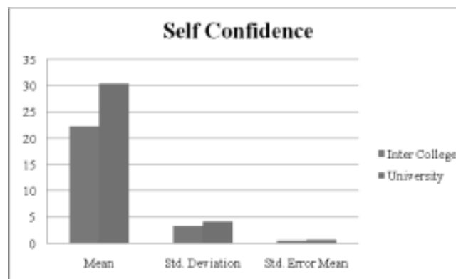
Fig.1 Graphical representation of variable self-confidence of inter college and university female volley ball players.

From table :- 1 It can be seen that the mean \pm standard deviation value for the variable self-confidence of Inter college and Inter university female volley ball players were found to be 22.27 \pm 3.33 and 30.53 \pm 4.175 respectively. Its graphical representation can be seen in fig.1.